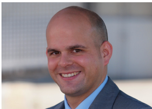
Bernhard Bichsel Präsident FDP.Die Liberalen KÖniz